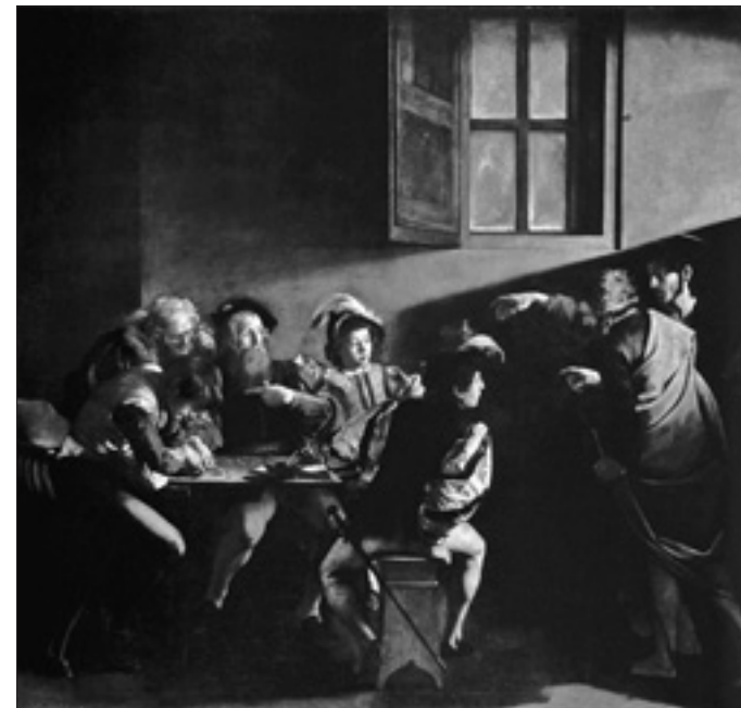
Caravaggio, «Powołanie św. Mateusza» (1600 r., kościół św. Ludwika Francuzów w Rzymie)

Po drugie, pyta mnie Pan, czy myślenie, że nie istnieje żaden absolut, a zatem nie ma też prawdy absolutnej, lecz jest tylko seria prawd względnych i subiektywnych, jest błędem lub grzechem. Na początek, nie mówiłbym, nawet w przypadku oso-