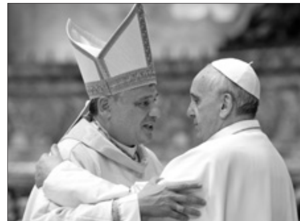
Podczas konsekracji biskupiej abpa Konrada Krajewskiego (17 września 2013 r.)

20 IX – Papież udzielił audiencji prezydentom – Węgier Jánosowi Áderowi i Hondurasu Porfirio Lobo Sosie, a także przyjął grupę katolickich ginekologów,