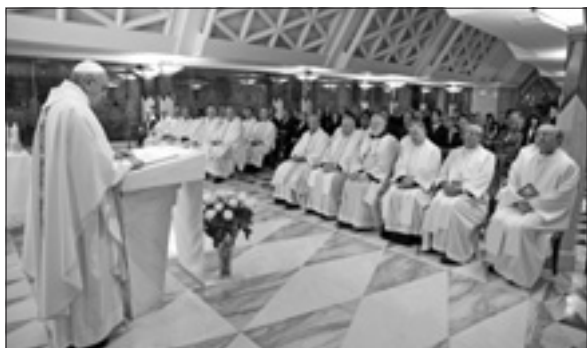
Msza św. w Domu św. Marty 1 października br. Streszczenia porannych homilii Papieża Franciszka można znaleźć na watykańskiej stronie internetowej www.vatican.va , a ich przekłady na język polski – na stronie www.osservatoreromano.va w dziale «Watykan»