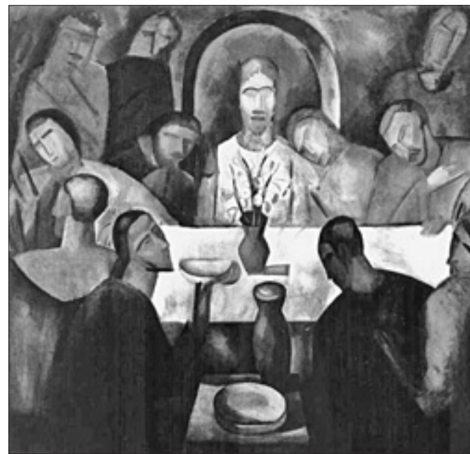
André Derain, «Ostatnia Wieczerza Jezusa» (1911 r.)

Drodzy bracia i siostry, uczestnicząc w Eucharystii, w nadzwyczajny sposób żyjemy modlitwą, którą Jezus wypowiedział i wciąż wypowiada za każdego z nas, ażeby zło, które wszyscy spotykamy w życiu, nie zwyciężyło i by działała w nas przemieniająca moc śmierci i zmartwychwstania Chrystusa. W Eucharystii Kościół odpowiada na polecenie Jezusa: «To czyńcie na moją pamiętkę!» (Łk 22, 19; por. 1 Kor 11, 24-26); powtarza modlitwę wyrażającą dziękczynienie i błogosławieństwo, a wraz z nią słowa przeistoczenia chleba i wina w ciało i krew Pana. W naszych Eucharystiach jesteśmy włączani w ten moment modlitwy, jednoczeni wciąż na nowo z modlitwą Jezusa. Od początku Kościół pojmował słowa konsekracji jako główną część pełnej wdzięczności pochwały, poprzez którą owoc ziemi i pracy człowieka zostaje nam na nowo dany przez Boga jako ciało i krew Jezusa, jako dar z siebie samego Boga w otwartej miłości Syna (por. Jezus z Nazaretu , II, s. 151). Uczestnicząc w Eucharystii, żywiąc się ciałem i krwią Syna Bożego, jednoczymy naszą modlitwę z modlitwą Baranka paschalnego w najcięższą dla