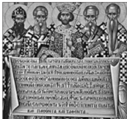
Ikona przedstawiająca ojców Ekumenicznego Soboru Nicejskiego

Szczególną historię narodu polskiego, w której były okresy demokratycznego współżycia i wolności religijnej – jak w XVI w. – znamionują w ostatnich wiekach najazdy i klęski, ale także nieustanna walka z uciskiem i pragnienie wolności. Wszystko to pobudziło grupę ekumeniczną do pogłębionej refleksji nad prawdziwym znaczeniem «zwiąśćstwa» – co to jest zwiąśćstwo – i «porażki». W odniesieniu do «zwiąśćstwa», pojmowanego w sposób tryumfalistyczny, Chrystus sugeruje nam zupełnie inną drogę, która nie wiedzie przez władzę i potęgę. Stwierdza On bowiem: «Jeśli ktoś chce być pierwszym, niech będzie ostatnim ze wszystkich i sługą wszystkich» (Mk 9, 35). Chrystus mówi o zwiąśćwie przez miłość i cierpienie, przez wzajemne usługiwanie sobie, pomoc, nową nadzieję i konkretną pociechę ofiarowaną ostatnim, zapomnianym, odrzuconym. Dla wszystkich chrześcijan najwyższym wyrazem tej pokornej służby jest sam Jezus Chrystus, całkowity dar, który składa On z samego siebie, zwiąśćstwo Jego miłości nad śmiercią – w krzyżu – które jasnie w