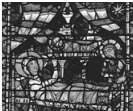
«Boże Narodzenie», witraż w katedrze w Chartres (XII w.)

ureczywistnia się, nie dzięki wielkości człowieka, który nie może stać się Bogiem, ale dzięki pokorze Boga, który uniża się i wchodzi w nas w swojej pokorze, i wynosi nas do prawdziwej wielkości swojego bytu. Tak mówi o tym Sobór Watykański II: «W istocie misterium człowieka wyjaśnia się prawdziwie jedynie w misterium Słowa Wcielonego» ( Gaudium et spes , 22); w przeciwnym wypadku bowiem pozostaje tajemnica: co to stworzenie – człowiek – ma oznaczać? Jedynie widząc, że Bóg jest z nami, możemy widzieć światło dla naszej egzystencji, możemy być szczęśliwi, że jesteśmy ludźmi, i żyć z ufnością i radością. I gdzie w realny sposób uobecnia się ta cudowna wymiana, aby mogła działać w naszym życiu i uczyniła z niego egzystencję prawdziwych dzieci Bożych? Staje się bardzo konkretna w Eucharystii. Kiedy uczestniczymy tym, w Mszy św., przedstawiamy Bogu to, co nasze: chleb i wino, owoce ziemi, aby On je zaakceptował i przemienił, dając nam siebie samego i stając się naszym pokarmem, ażebyśmy przyjmując Jego Ciało i Jego Krew, uczestniczyli w Jego Bożym życiu.